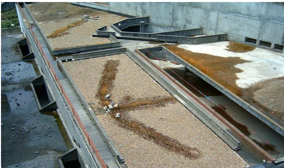
Plantas en una cubierta invertida