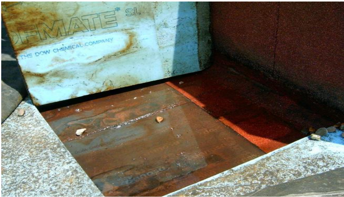
Agua bajo Roofmate