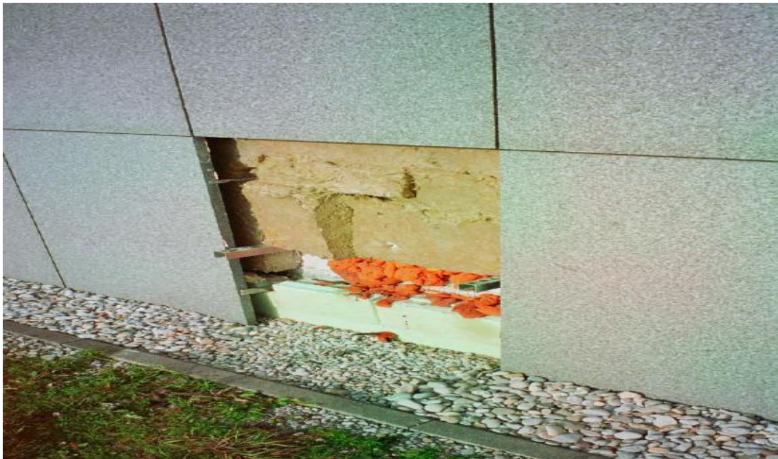
Lana de roca fragmentada