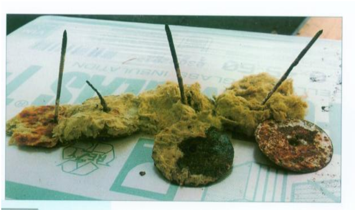
Fijaciones mecánicas Lana de Roca