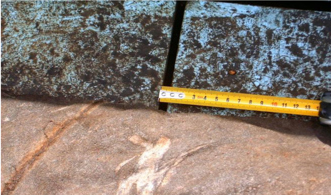
Puentes térmicos XPS